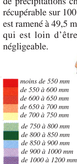
Pluviométrie en Haute-Normandie

Dans une zone plus sèche comme le sud du département de l’Eure, où il ne tombe en moyenne que 550 mm de précipitations chaque année, le volume récupérable sur 100 m 2 de toiture est ramené à 49,5 m 3 , ce qui est loin d’être négligeable.