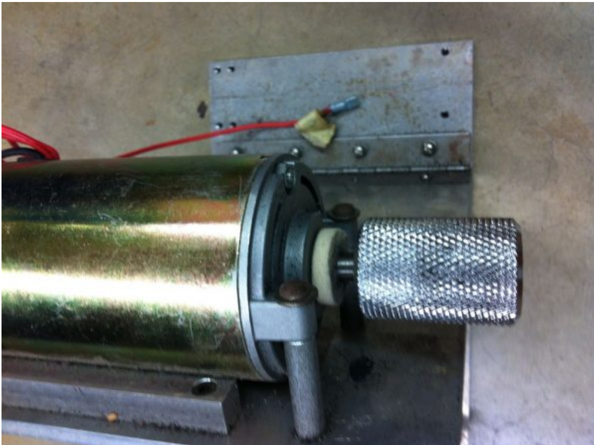
Le galet, fait le lien

La différence de taille entre votre roue et le galet étant important, une vitesse comprise en 20 et 30km/H suffira à fournir un régime correct à votre moteur.