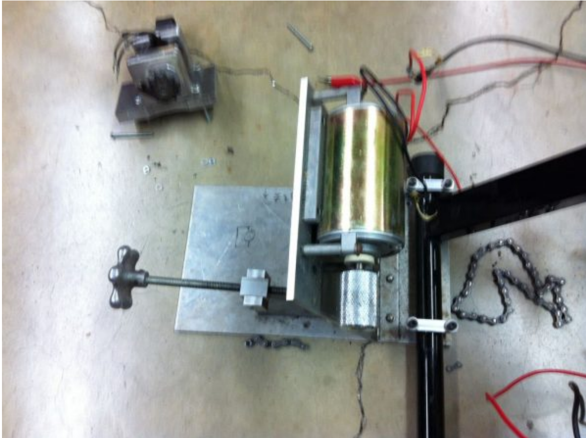
Bloc moteur moteur réglable