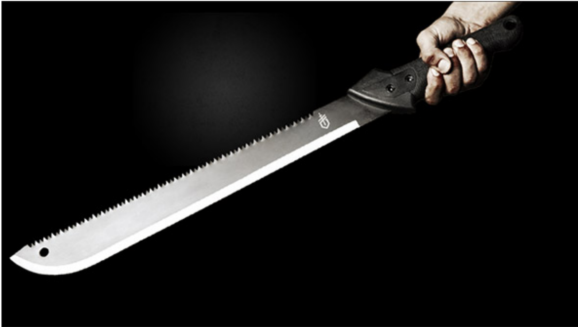
Machete Gator Gerber