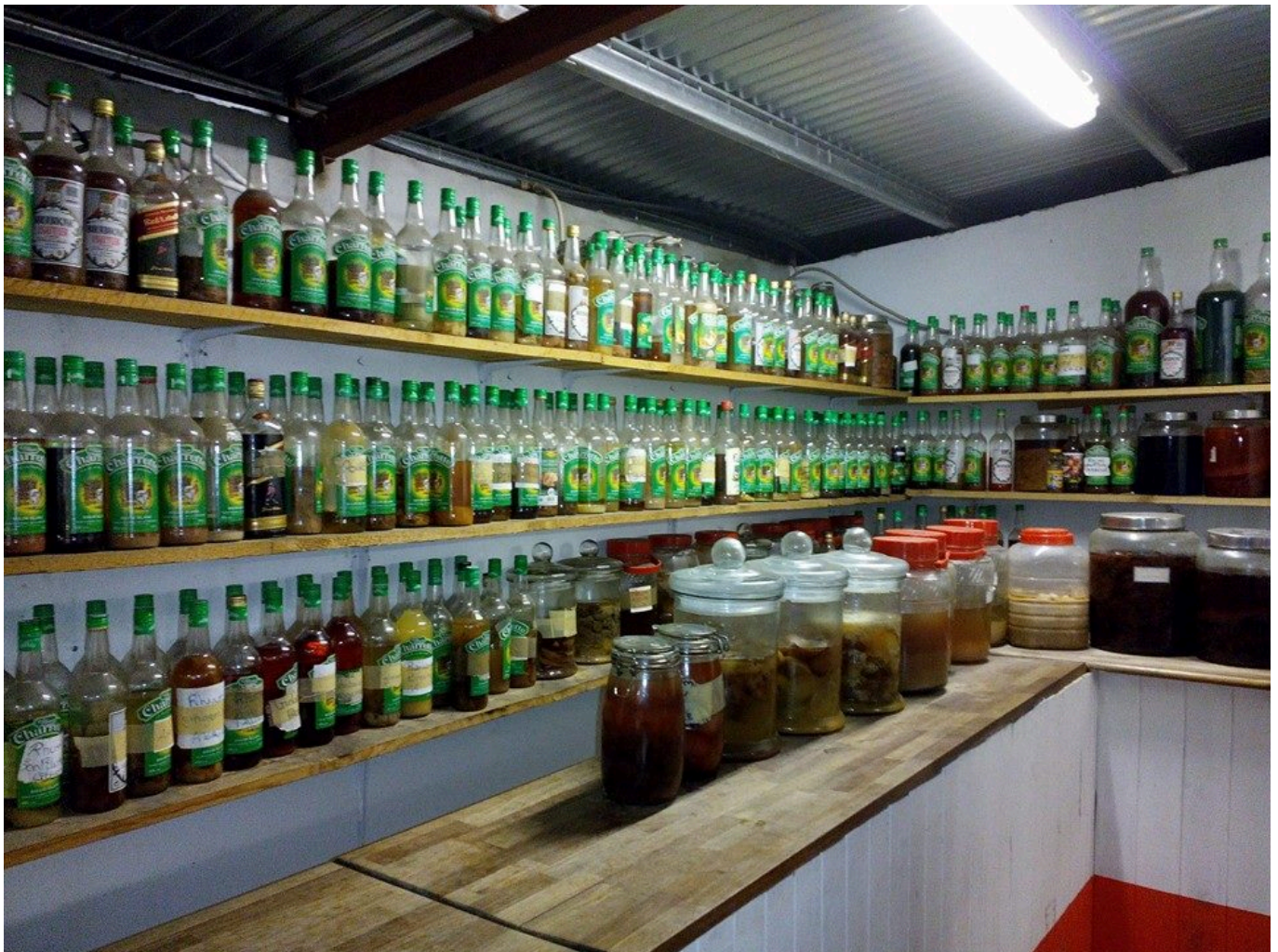
Quelques bouteilles de rhum arrangé à la boutique

(roche volcanique) qui favorise l'infiltration. Bon par contre on trouve pas mal de boutique avec du rhum (sauf le dimanche)! Pour l'est, coté vent, il y a plus de précipitation et donc plus de cours d'eau. Dans les hauteurs, les 3 cirques (dont la magnifique Mafate) sont drainés par trois rivières principales.