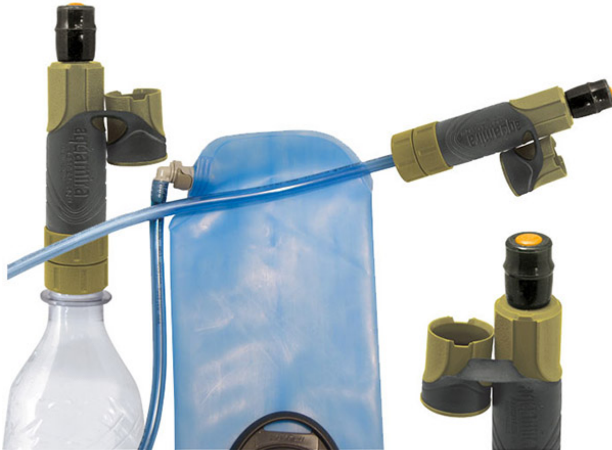
de filtration Aquamira Frontier Pro